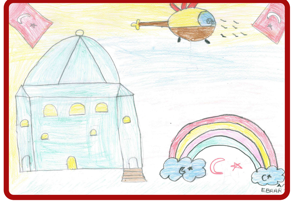
Ebrar KIRÇIÇEK 1/A