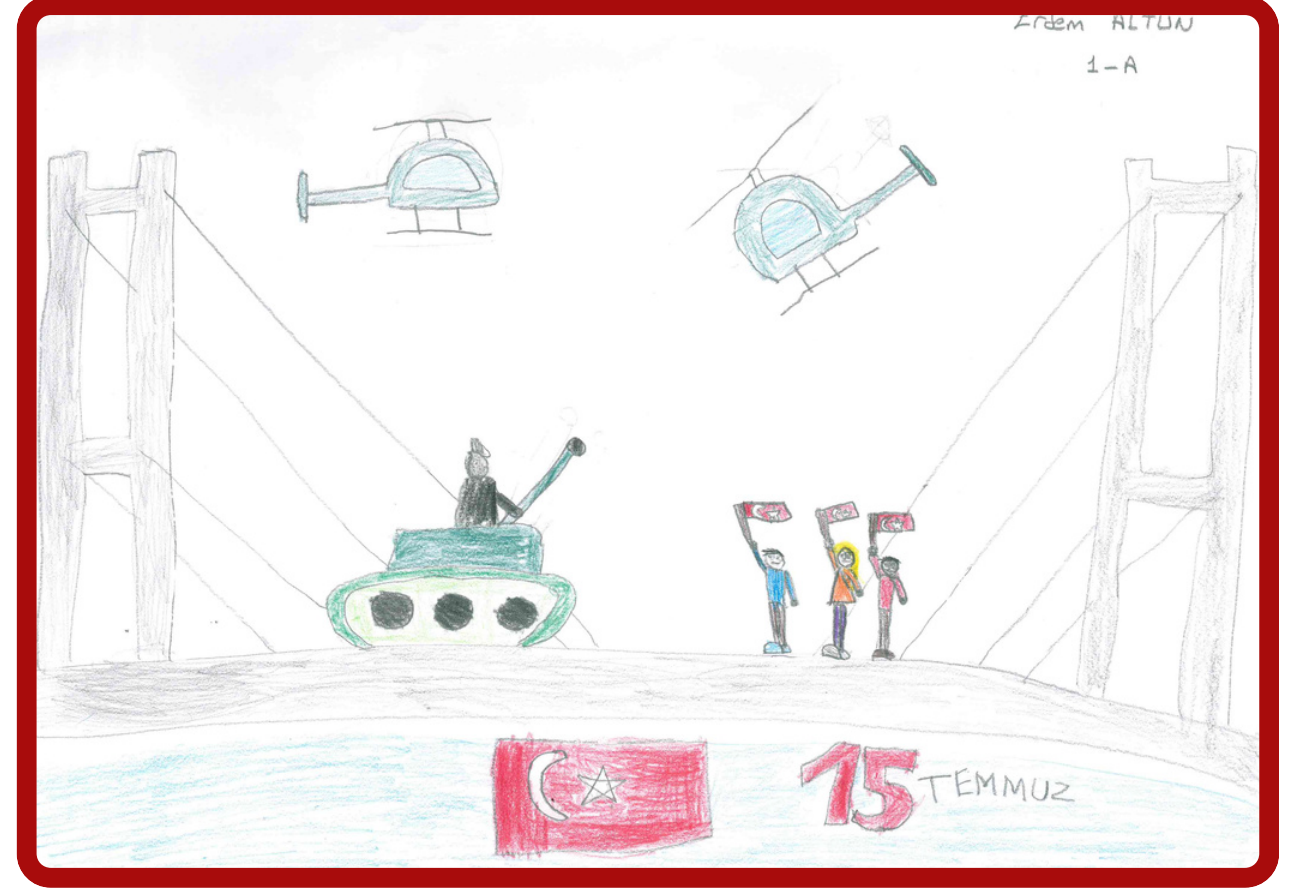
Erdem ALTUN 1/A