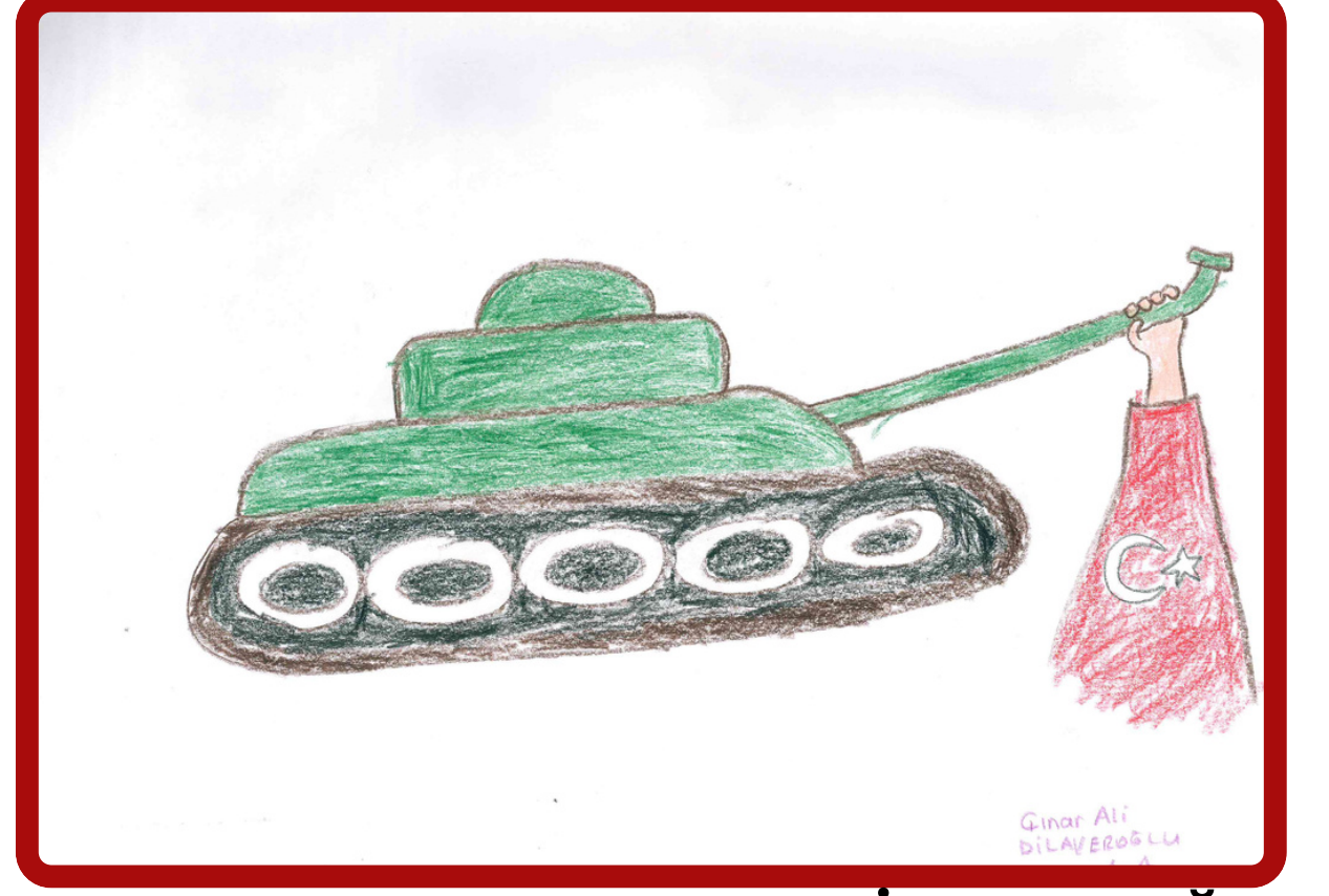
Çınar Ali DİLAVEROĞLU 1/A